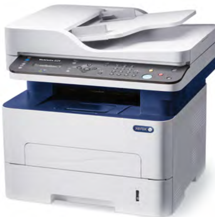
WorkCentre 3225. Copiere. Imprimare. Scanare. Fax. E-mail.