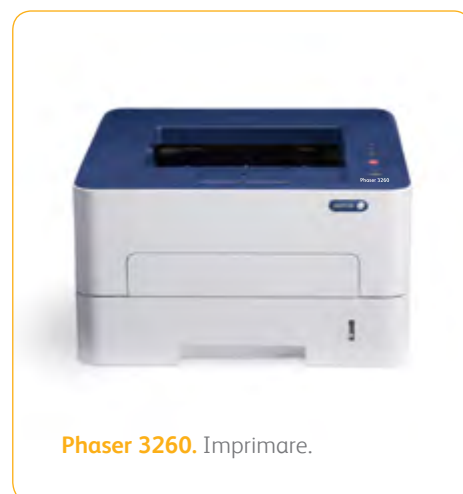
Phaser 3260. Imprimare.